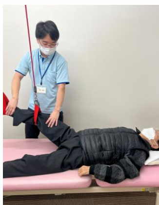
股関節可動域訓練